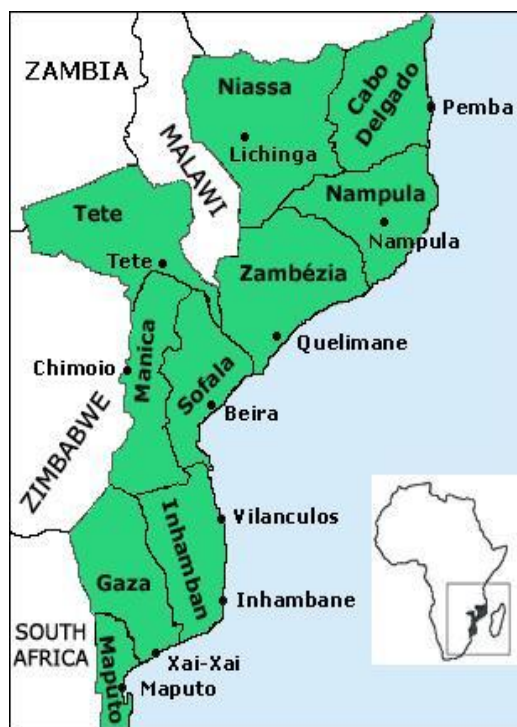
Figura 1 - Mapa de Moçambique e a visualização do país no mapa do Continente Africano

A República de Moçambique está situada na costa Oriental da África Austral entre os paralelos 10°27' e 26°56', latitude Sul e Meridianos 30°12' e 40°51' a Este (Figura 1). Tem uma superfície de 799.380 km 2 e é banhada por uma costa de cerca de 2.515 km de Oceano Índico. O clima é